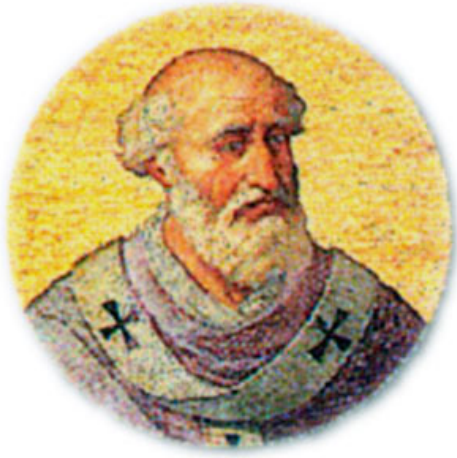
Папа римский Урбан II