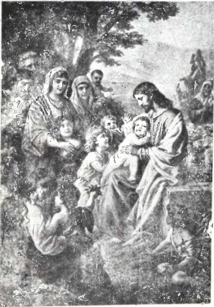
იესო ქრისტე და ბავშვები.

ასე მაღალი შეხედულობისა მაცხოვარი ბავშ- ვებზე. რამდენად სანასუნო საქმე აქვს იმას, ვი-