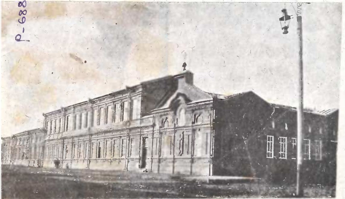
კავკასიის ქართული სკოლა, თეატრი, ეკლესია და საკრედიტო ამხანაგობა.