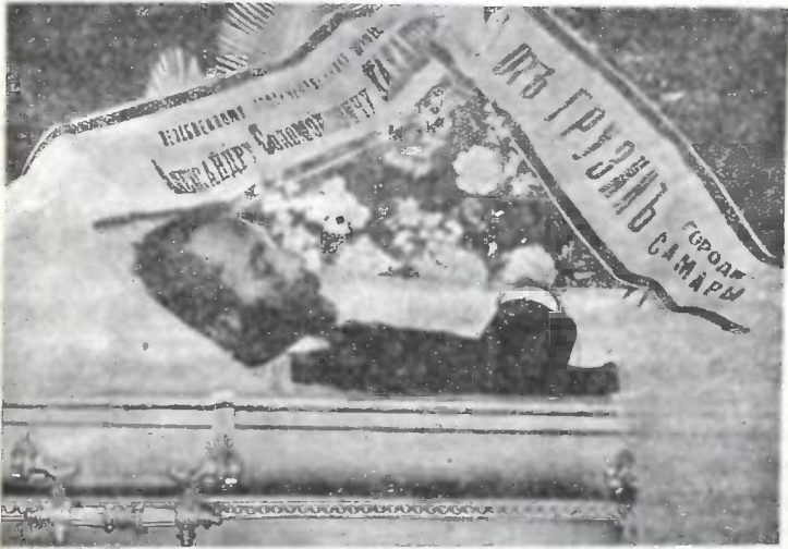
პროფ. აღექსანდრე ხახანაშვილი კუბოში.

ჩვილი იყო, ახსოვდა და უყვარდა თავისი მეგობარ-ნაცობნი, თავისი ნათესავ-მახლობელნი, თავისი მოკავშირე-კოლეგები სამწერლო და სამეცნიერო ასპარეზზედ. გამოჩენა თუნდ პატარა ნიჭის მწერლისა და მგონისაც-კი ჩვენის ლიტერატურის ცახედა ახარებდა აღექსანდრეს, ააცივინათელავებდა ხოლმე მის კეთილ თვალებს და მის შეგვრემანს სახეს ნათელი გადსდიოდა ამ დროს.