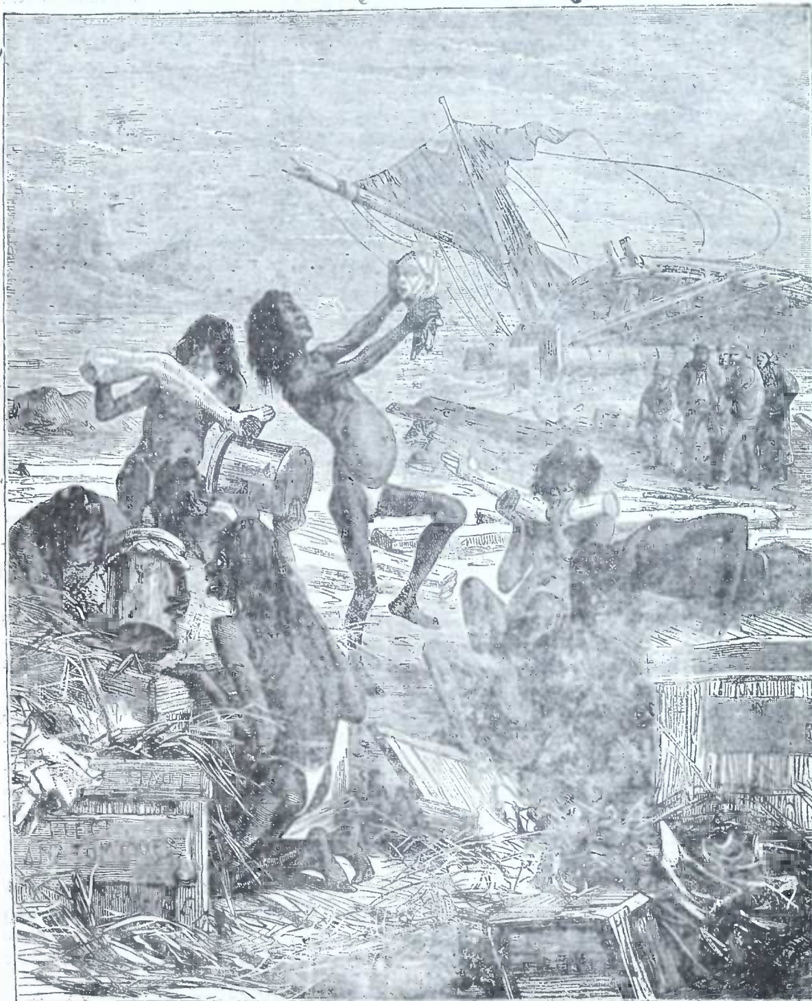
■ კაცის-ჭამია ველურები.