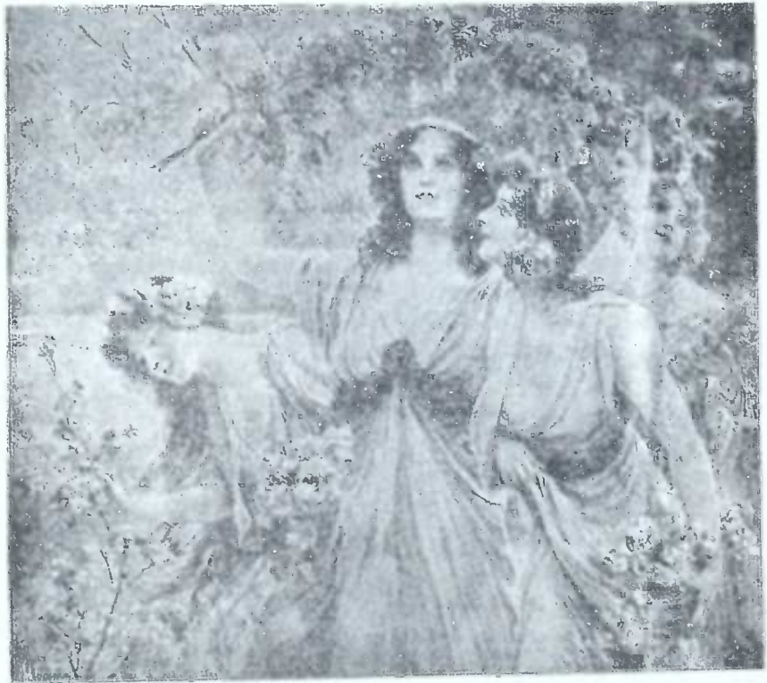
გ ა ზ ა ფ ხ უ ლ ი .

რედაქციის სახელით მოულოდნელი ტენსიური დაბრუნების გამო ეს ნომერი ნაბეჭადი და უკარგობით გამოდის.