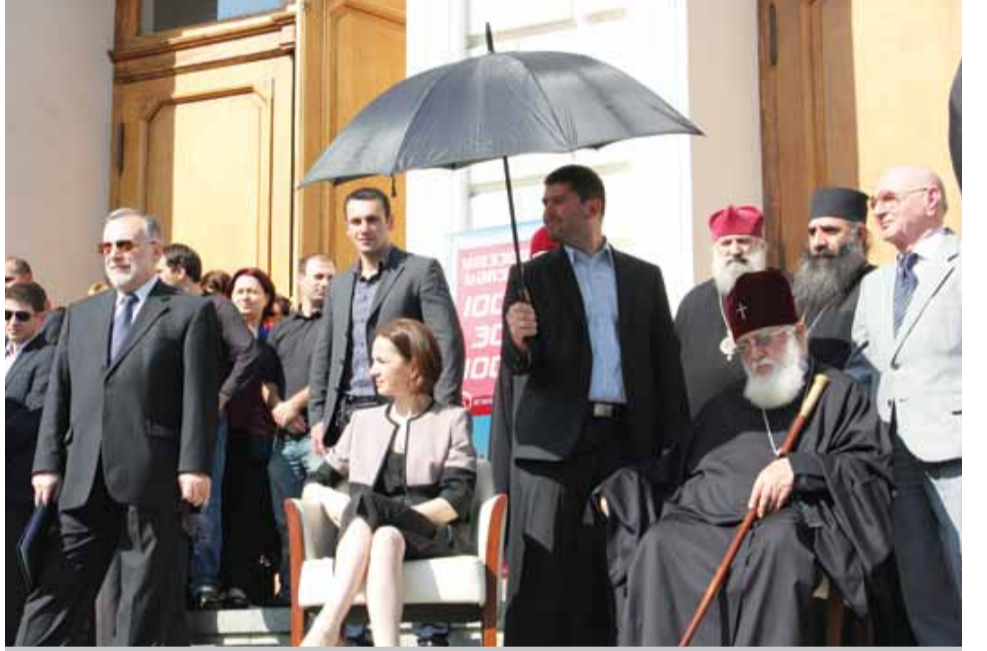
ახალი სასწავლო წლის დაწყების ცერემონიას თსუ-ში პატრიარქი ილია II და განათლებისა და მეცნიერების მინისტრი თამარ სანიკიძე დაესწრნენ

100 დღე, ერთი მხრივ, საკმაოდ დიდ დროს მოიცავს, მაგრამ ძირეული რეფორმების გატარებისთვის ეს მაინც მცირე პერიოდია.