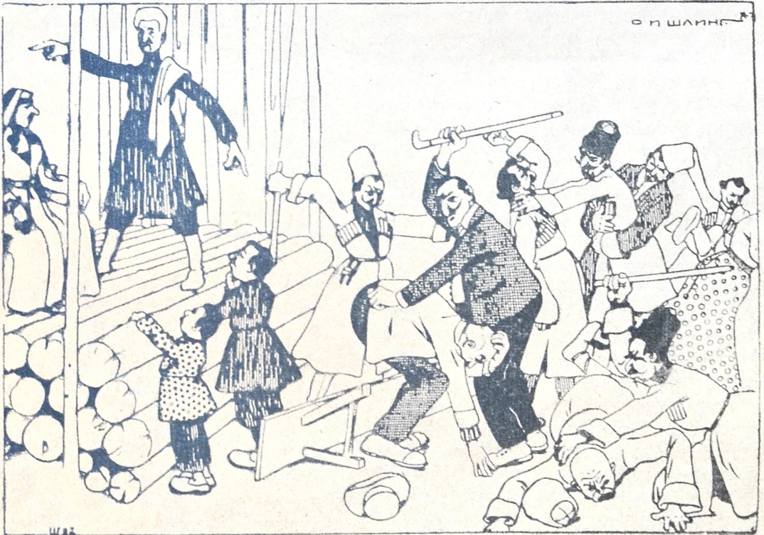
დაბა-სოფლებში წარმოდგენების გამართვა.

იმ ალაგას სადაც დამჩინეს, მუყურთან თავი ვაჭრებს და არის ოკენანეს ხელა ნარდის თამაში. აბა რომელი რომელს. ზოგი დორთ ჩარით მოგე- ბულ ფარით იხთის მესხიშვილის იუბილეს, ზოგი— თუ დუშაში მუა გაზეთ-ნახევრის წამკითხველი ვარო, ზოგი თუ იაგენბი გამიგორდა ვალდებულ