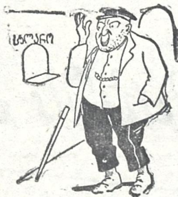
და გაპარცვული იზიმი იზი:

„ბალადის ქუჩა“!.. ახ, უნდა ვნახო, და სალაროსთან, მსურს, მივსდგე ახლო... (ქუჩო, შენ ჯიბეს ხელი არ ახლო!)