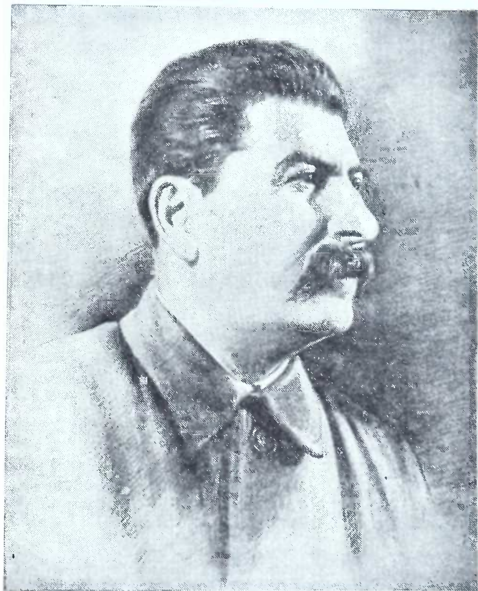
ი. ბ. სტალინი