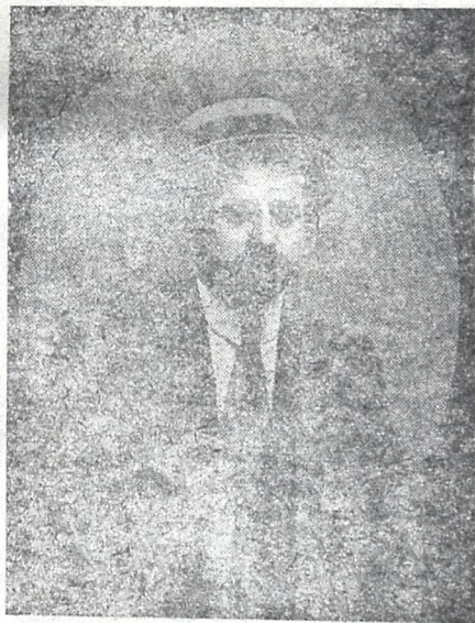
მენშევიკების ჯალათების მიერ 29 დეკემბერს მუხანათურად მოკლული

ამ ტყვიას შეუძლია მოგვტაცოს მხეცურად თითო-ორიოლა ამხანაგი, მას შეუძლია მოგვაყენოს ჩვენ ფიზიკური ტყვიელები, მაგრამ ფაქტიუ-