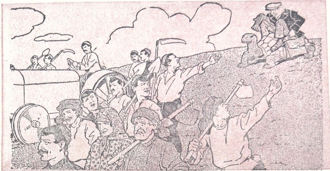
ეს უკან დარჩა გზაში—