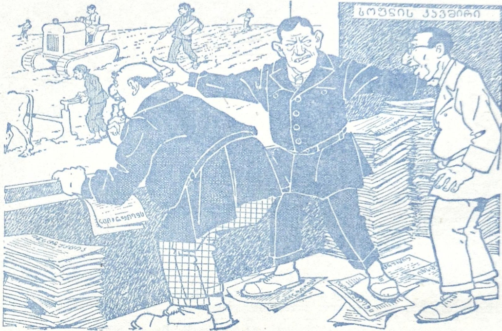
გახურებული ხენა, მიწა ვერ უძლებს რკინას, სოფლის კავშირს კი ისევ მაშა-პაპურად სძინავს.