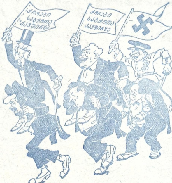
ხაბჭოთა კავშირს უტევენ ცილისწამებით, ჭორებით, მთელი ქვეყნის უსაქმო, მცოხარა—მუქთა ხორებით.

აზიანაგებო, ხედავო— მოდის ხულ სხვა ძალა.. შეხეთ სოფელს ფერი როგორ შეეცვლა. ვინც ძლივს იხრიადა კაცი ანგულს და ახოს— დღეს მოვიდებ, ჩვენი შრომა დაინახოს. ვინც ეძებდა ლუკმას უბარაქოს, დღეურს— დღეს შეხედოს სოფლას შრომას კოლექტიურს, რაც ვერ შეხლო გლეხს დაკაპულმა ძალამ, მის საერთო შრომამ ხაზე შეუცვალა... მაგრამ ზოგი „ბრძენი“ საქმეს აქაც ახდენს. ხურს საქმე დღეი— უცაბედაი ახდენს. ზის ქალაღებს ჩხანის, ან არა და ბრძანებს, შნა ჭადი და პური რომ მოეხხას ყანებს. ერთი ამ ბრძენს დავე ზღვა ხურს კოვზით აწვობს „პრიკაზ-ბრძანებით“ კოლექტივებს აწვობს. პირველ როგში უტევს ჭათებებსა და ბატებს. ის არ იცის, ამით ისევ კულაკ შმატებს.. არ ვაუშვია თუ კი შეხვდა ერთი-ორი ან კულაკი ძროხა, ან თხუნულა ღორი. ცხაკ არაფერი, გეუბნებით მართალს, ხელი მიჭეო კვერცხის ღორცხვას და დათვლას. ჭათობს ასე უტებს, საქმეში კი ზანტობს. ჩვენ „ბრძენს“ თავზე ხაღტი,— ჭევა არ დაეფანტის! ასეთია ბიჭი, აღარ ახსავს თეგა. აღარ ახსოვს, არა რა გვეჭრებდა დღეს. რას მიჭეოა გლეხთან ხაუბარი ტკბილად. ახსნა-განმარტებით არ წუხდება ტყვილად. —შევა კოლექტივში, თუ არა და—მივიცხებ, რომ უმატოს თავში