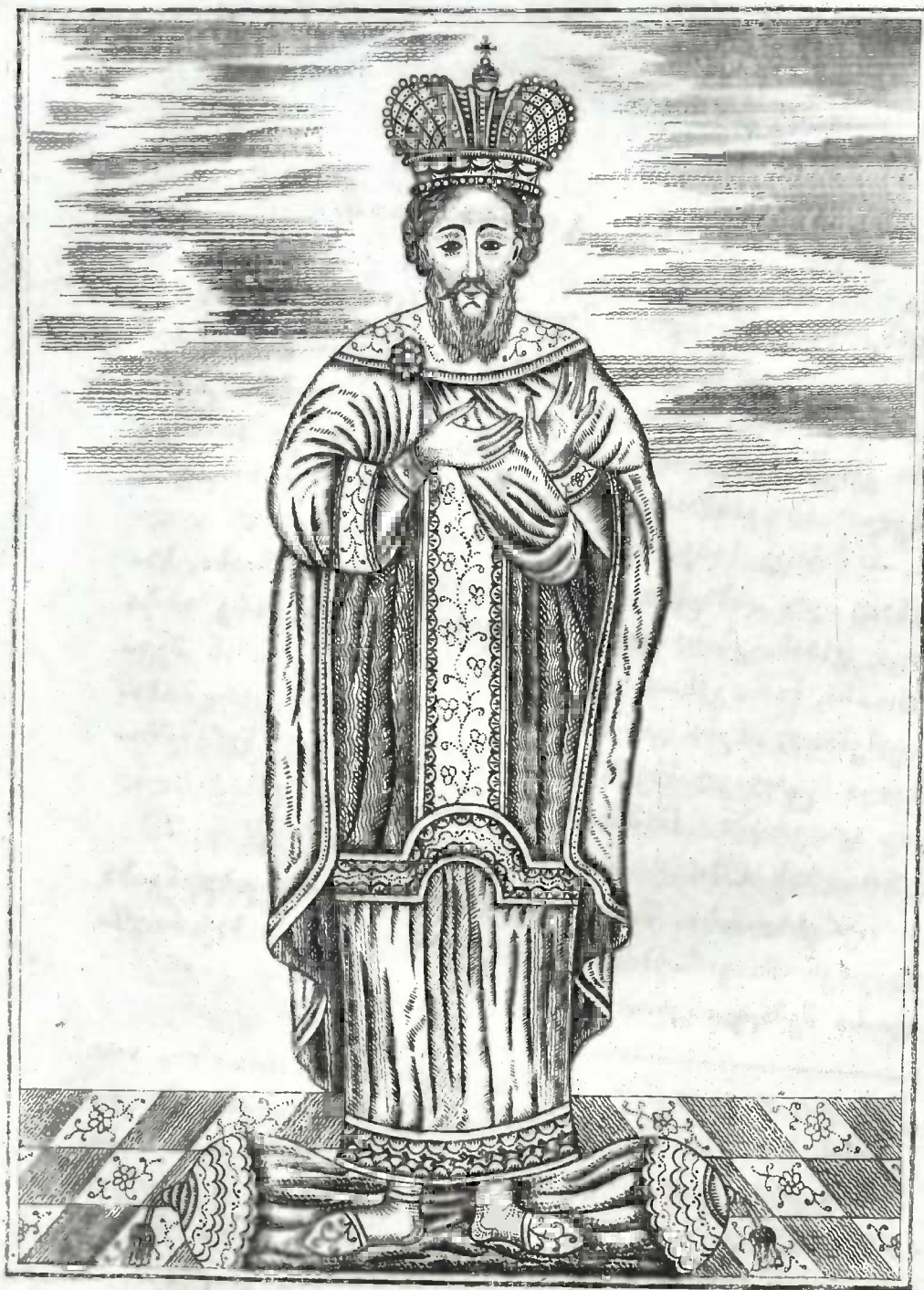
მეფე ვახტანგ გორგასლანი