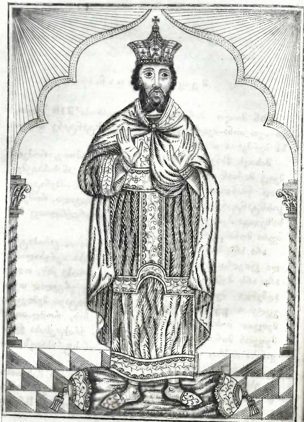
მეფე შიშინან ხანსტანნი