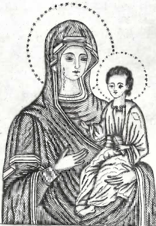
ივერიისა ვარისა ღუთის მშობელი