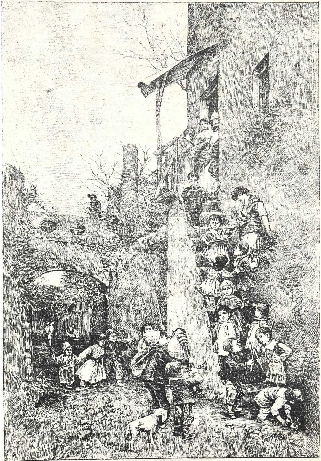
იტალიაში შობის დღესასწაული