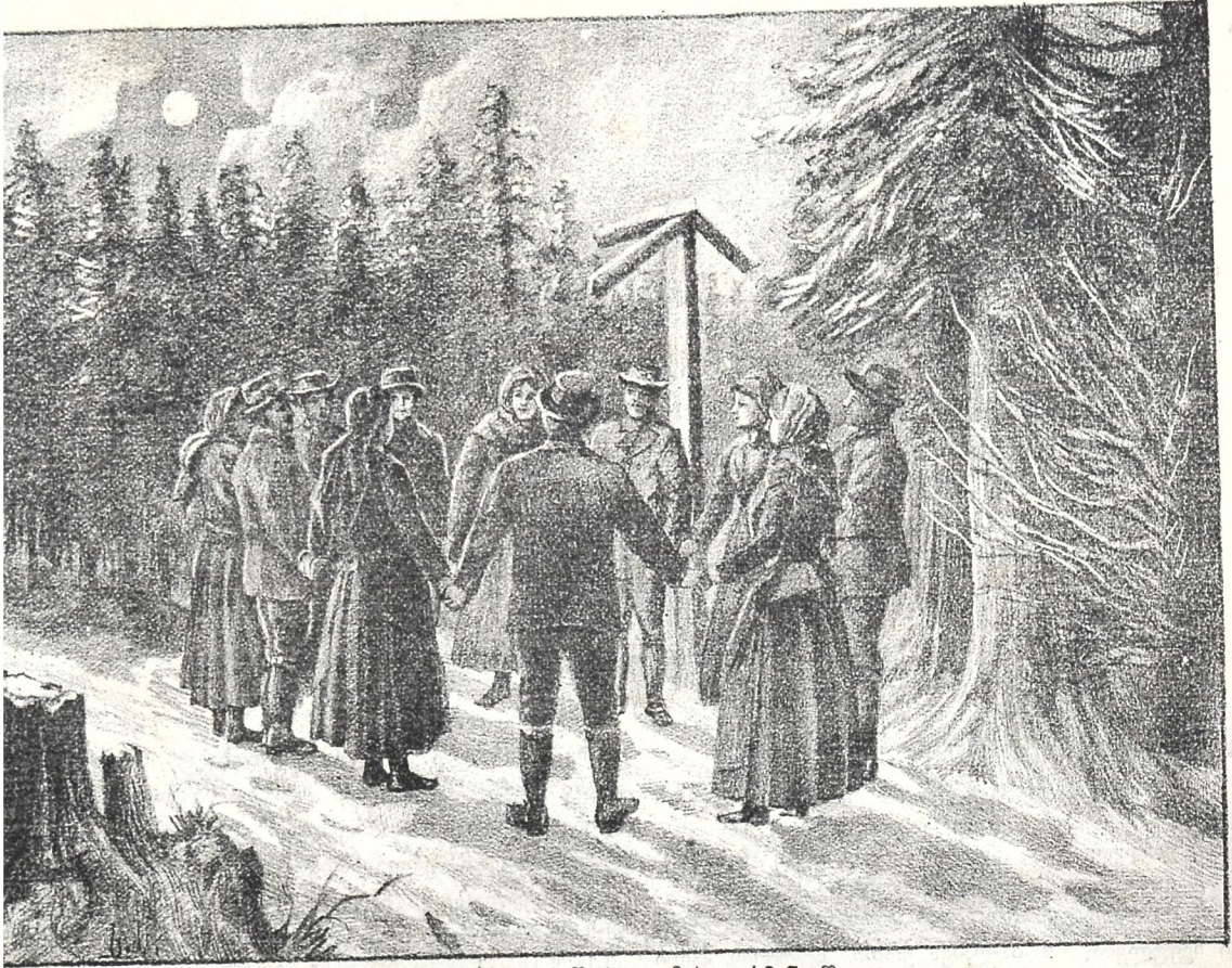
ფერხული შობა ღამეს გერმანიაში

მელსაც დღესაც აღტაცებაში მოჰყავს ყმაწვილები ისე, როგორც ამ ასი და ორასი წლის წინათ ყოფილა. გულის სიღრმემდის ჩამწვდამი სტიერის ხმა გრძნობას უღვიძებს ხალხს. ყმაწვილები ამ ხმაზე თვითონ დაიწყებენ გალობას. სტიერის რაკ-რაკი შორს გაისმის და ღმობიერებით ავსებს მორწმუნეთა გულს. დამკვრელი ყოველთვის ორი ყმაწვილია. მათ ვარს შემოერთების ერთი გროვა შეთვალ-წარბა და ცეცხლ მფრქვევ თვალეზიანები, რომელნიც ცდილობენ შესტიერების ხელობის სწავლასა და თან სტიერს აყოლებენ თავიანთ ხმებს.