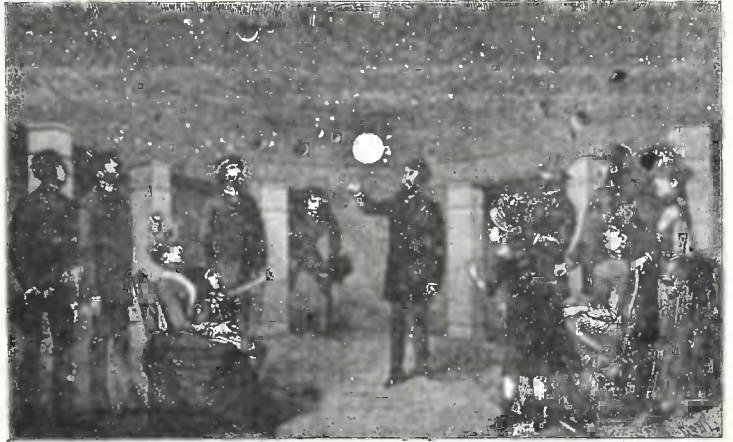
პროფესორ პერინის პლანეტარი.

ვეულებრივი საათი მხოლოდ დროის მაჩვენებელია. მაგრამ ამას გარდა საჭირო იყო ისეთი საათებიც, რომელთ უნდა ეჩვენებიათ მზისა, მთვარისა და სხვა ცთომილთა მიმოსვლა, მოძრაობა. ბევრგვარიც არის ასეთი საათი ერთი უძველესი საასტრონომო საათი დღეს დაცულია პარიზში, წმ. ენევეევის წიგნთ-საცავში. ეს საათი გამოიგონა ჯ მომართა მათემატიკოსმა ორანსფინემ. მეორეც მეჩვიდმეტე საუკუნეში გამოიგონა ასტრონომმა გიუგენსმა. მაგრამ ყველა ამ სასტრონომო საათებს პროფესორ პერინის პლანეტარი აღე-