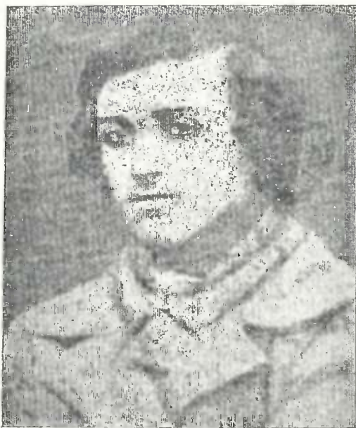
გ. ჩირიეთელი ახალგაზდონაში (1861)