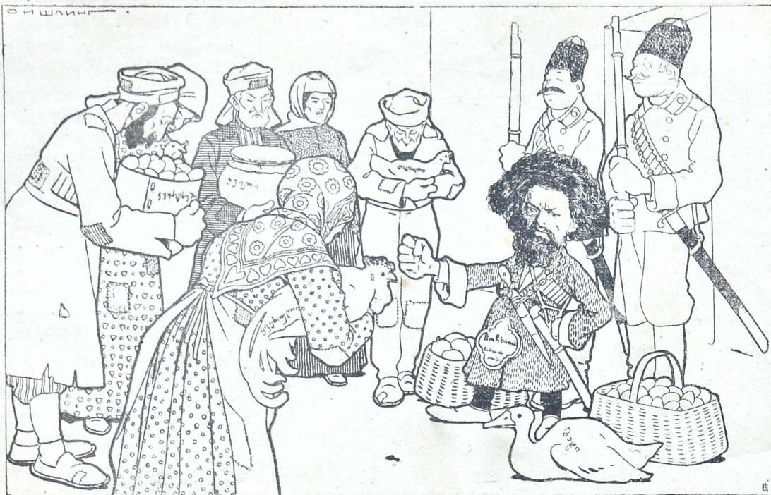
სიზმარი გურული თავადისა.