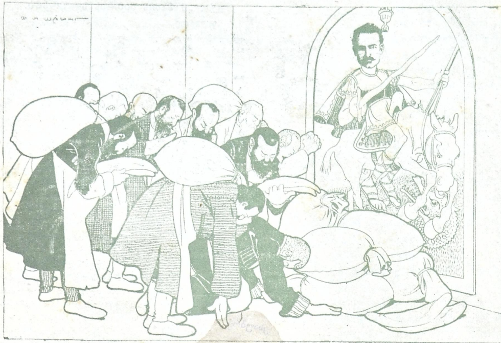
რაქველი „წმინდა გიორგი“

რაქველი „წმინდა გიორგი“ ერთობ ძლიერი ხატია... „სორაპანის“ სტამბის მუშები უმუშტოთ არცა დატია. ხელთა ჯუპურია თილისსმა ქანქართა ანდამატია, მეზურე რაქველებისგან მკიდრო დააწყია პარტია. „სოციალ უნილობაშები“ დარაზმა „სბორჩიკებადა“ და ააჭყუა მლოცველებს გროში თუ რამე ებადა. წარმოუვლინა სანაცვლოთ „ცის ნამი“ მრავალ ქებული, ვითარცა თითონ „გიორგი“ აზრიდან გადღებული. თვინიერ დაპირებისა მეზურეთ ინტერესებსა არად ავღებდის, ბეჭდვლის „წმინდა გიორგის“ ლექსებსა. ბოლოს მიუხვდენ რაქველნი და ამა „წმინდანს“ ძრახავენ,