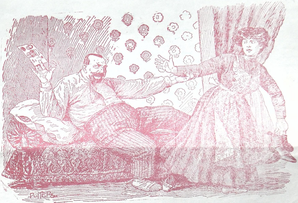
ბურჟუას — მსხვერპლი.