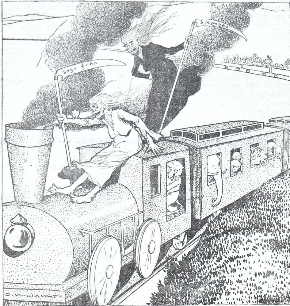
და იმისი მოსალოდნელი მკზაურები