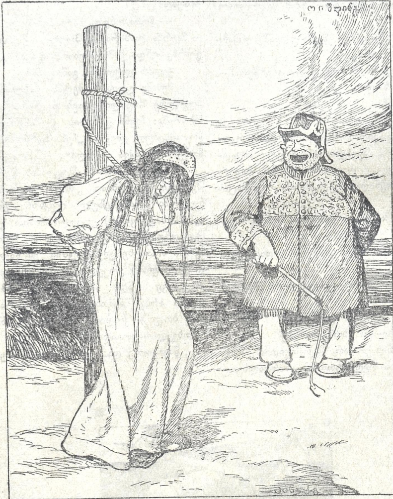
წამების ბოძზედა განაკრავს სტანჯავდენ ბნელეთის ქაჯები