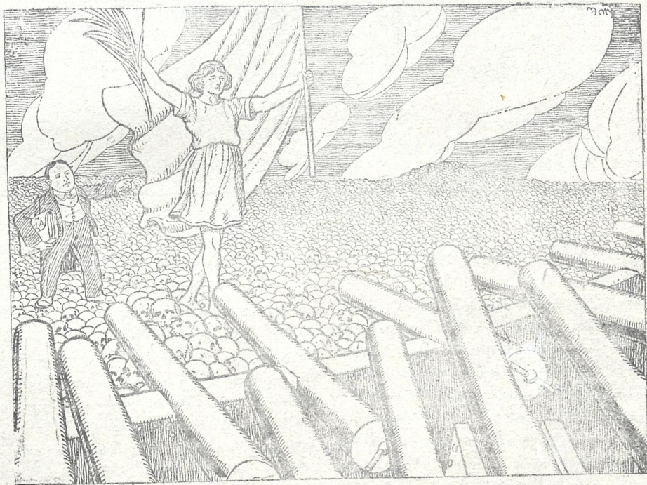
ტერე შჩენკო. წადი ქაღალტონო, მეგრამ არა მეონია ჩვენმა მოკავ- შირეებმა გაატარონ. წადი, ენახოთ...