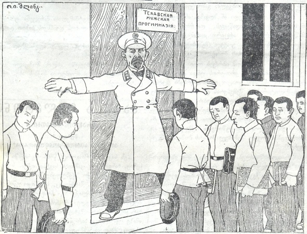
— რა საჭიროა თელავში მეშვიდე კლასი? ანაბანა ხომ ისწავლეთ და გეყოთ. ახლა თავისუფალი ხართ, გაისეირნეთ საითაც მოგეხალისოთ.

„თელავის პროგრამული მუშვიდე კლასი არაუგანისნება“. (გაზეთებიდან)