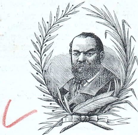
† ალექსანდრე ნიკოლოზის ძე ოსტროვსკი.

ტელეგრამებმა გვაცნობეს, რომ 3 ივნისს, კოსტრომის გუბერნიის, თავის საკუთარ მამულში, გაჩაღდა რუსეთის გამოჩენილი მწერალი და მაღალნიჭიერი დრამატურგი ალექსანდრე ნიკოლოზის ძე ოსტროვსკი. ეს დაუფასებელი მწერალი თითქმის ოც-დაათ წელიწადზე მეტს შრომობდა რუსულ თეატრისათვის და ამ ხნის განმავლობაში მან დასწერა მრავალი პიესები. ყველა მის პიესებს პირველი ალაგი უჭირავსთ რუსული დრამატიულ მწერლობაში.