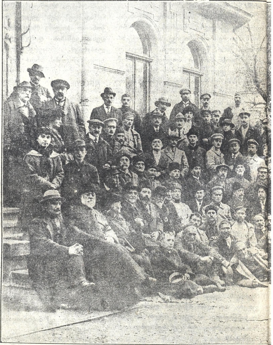
ს ა ქ ა რ თ ვ ე ლ ო ს ბ ე ლ ვ ი ნ ე ბ ე ე