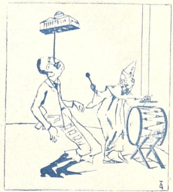
ჩენნი დროის ჯამაზებნი.

ფხაკუნი — შიქარადებული ჯახანუბა (შემღებნი ქინება)