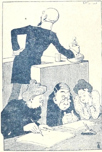
პურიშეკვიჩი. უინ ასსენა აქ კანსტიტუცია? სუ თუ მომეყურა!!!

მეიდველებს ეთობა 20 პრ. გამოწერა შეიძლება ნაღდ ფულზე და ფასდაღებით. მთავარი საწყობი „შრომის“ სტამბაში, მიხეილის პრ., 6წ.