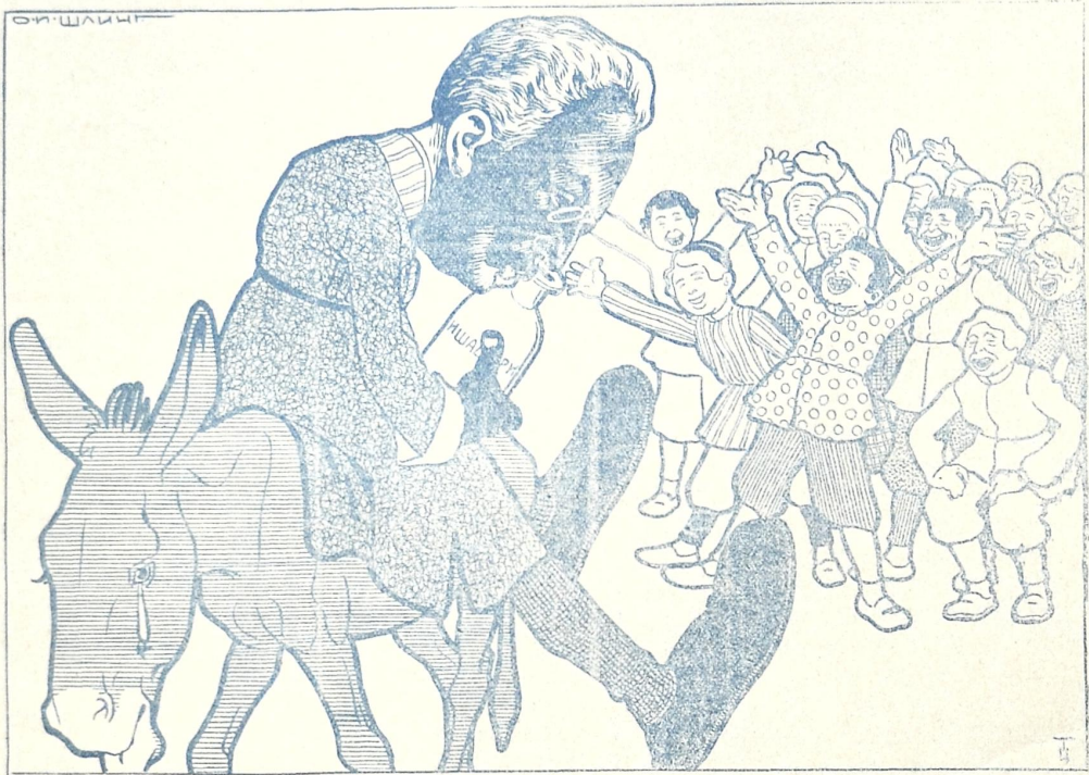
ქურდის დასჯა სოფელში ერთობის დროს.