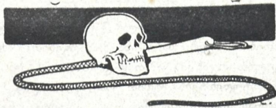
პარღნი არ სჩანან!..

პეკინი , ჩინეთის მთავრობა სთხოვს რუსეთისას: ჩინეთის თავიუფალ ადგილებზე რუსეთმა ყაზახ რუსები დაასახლოს კულტურის შესატანათ.