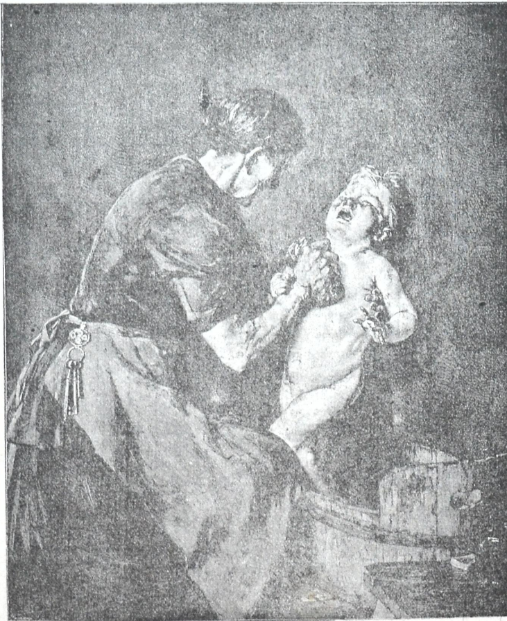
ნუ სტირი ბებიავ, გაგრილდები.