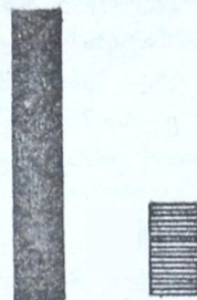
საკრედიტო კოოპერატივების ზრდა ქართულ კახეთში