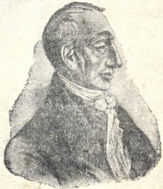
ს. ნ. მ. გ. ნ.