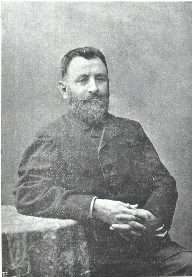
იაკობ გოგებაშვილი (1840—1912)

მისამართი: თბილისი, Габаевский пер. № 3 რედაქცია „კვლევა“. დეპოზიტის: თბილისი კვლევა.