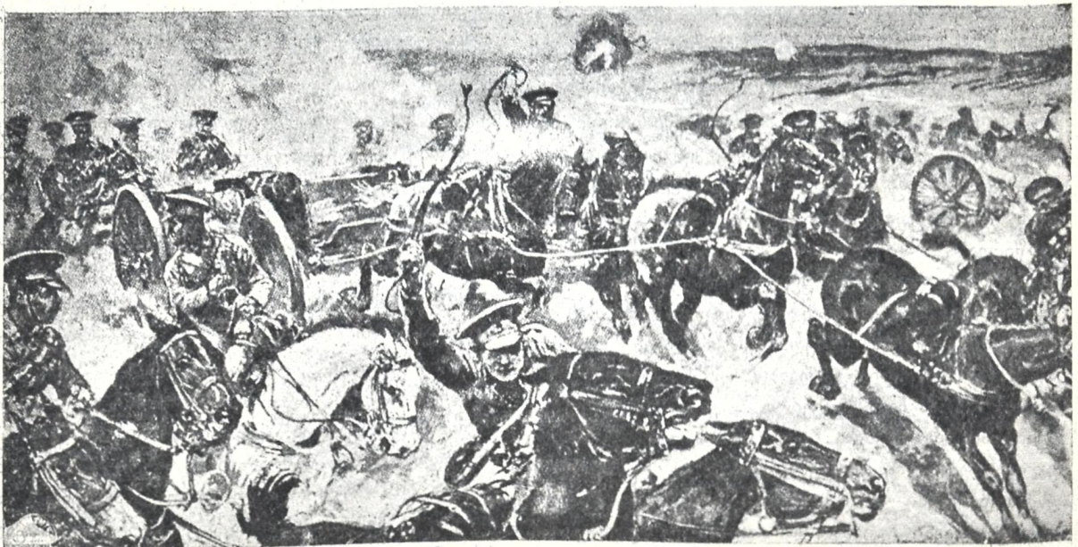
ინგლისური არტილერია მიისწრაფვის პოზიციებზედ.