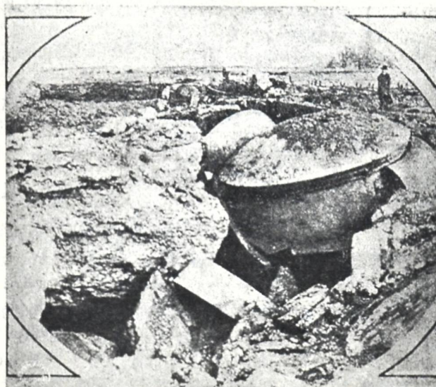
ბეტონის ერთ-ერთი სიმაგრე ლიეუში, რომელიც გერმანიის მძიმე არტილერიამ დაანგრიო.