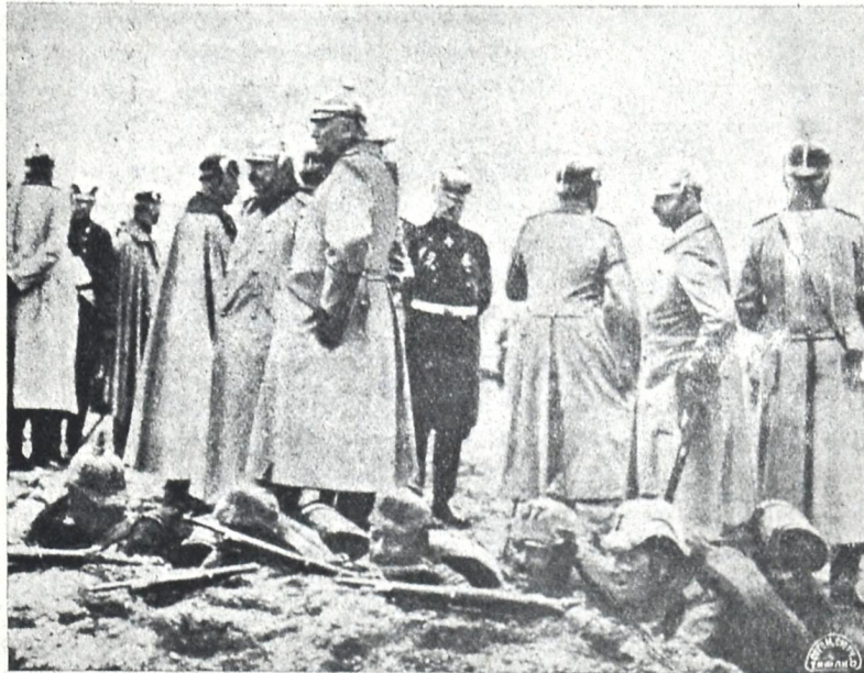
გერმანელთა ჯარი. იმპერატორი ვილჰელმი და მთავარ შტაბის უფროსი ფონ-მოლტკე საპოზიციო თხრილებთან.