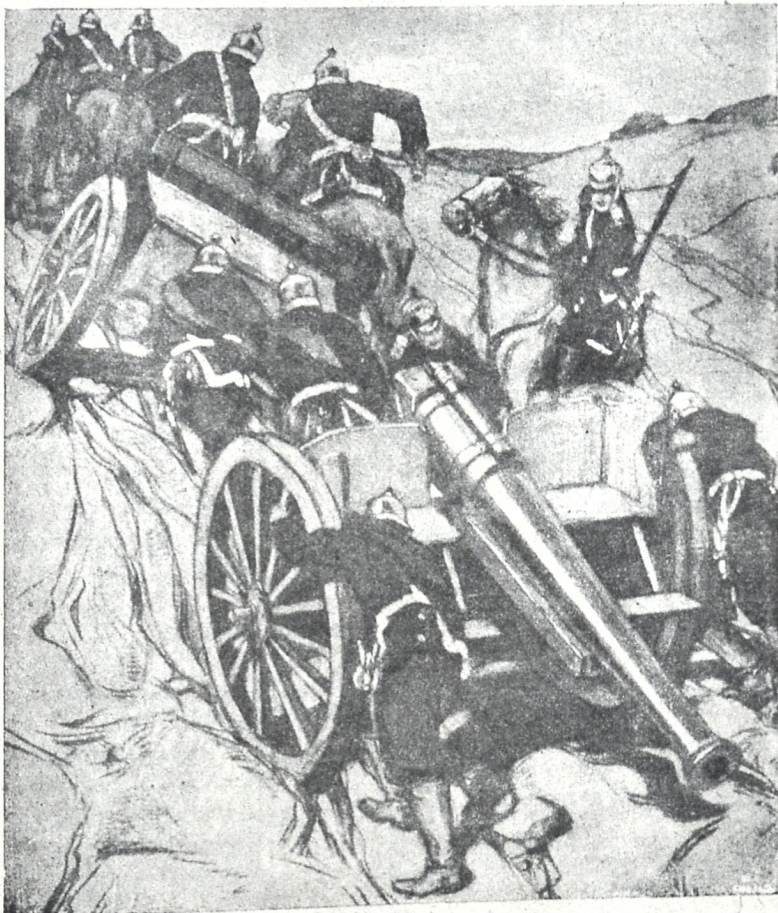
ბერმანელები გარბიან. ნახ. ლოდვიგინისა.

მისამართი: თბილის., Габაевский пер. № 3 რედაქცია „კლდე“. დეპეშისა: თბილისი კლდე.