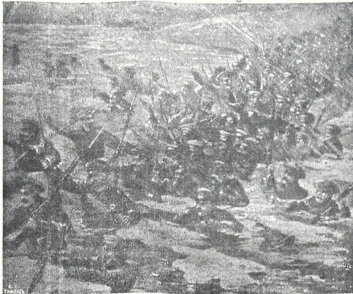
გაყინულ წყალში გადასვლა რუსის ჯარისა მდ. რაბაზედ.

რა-კითხვის გამავრცელებელი საზოგადოება“ ერ- ქვა.