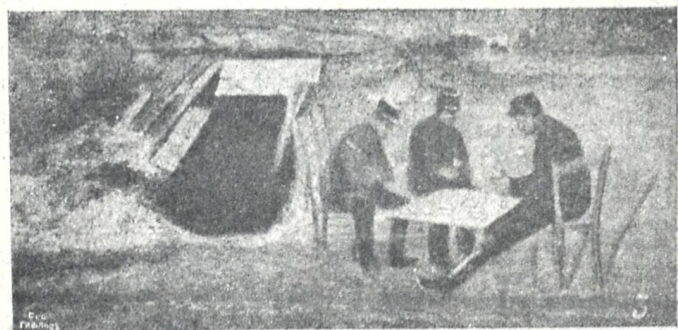
ფრანგების ჯარი ბრძოლის ველზედ ერთობა.

დაუჯერებელი ამბავი ის იყო, რომ აქამდისაც საქართველოს ეკლესიის ავტოკეფალიის იდეა თითქმის რევოლიოციონურ იდეად ითვლება და ამისთვის ხალხიც ისჯებოდა, თორემ გასაკვირველი კი არა სავალალოა, რომ ის იდეა ეკლესიის თავისუფლებისა, რომელიც ასულდგმულებს ყოველ მორწმუნე ქართველს, მარტოდენ შეეძლება გააღვიოს ის ეროვნულ-სარწმუნოებრივი ძალა, რომელსაც მსხვერპლად ეწირებოდნენ საუკეთესო შვილნი ჩვენი, ისტორიისა რაც შეეხება კირიონის რეპილიტაციას, ჩვენ არ ვიცით, რამდენადაა იგი ნამდვილი, თუ სადმე რუსეთში გაამწესებენ.