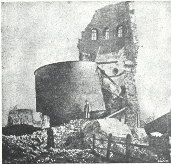
გერმანელებისაგან აფეთქებული წყლის კოშკი ქ. ლოდში.

აი, როდესაც საკითხი სდგება იმისა, თუ რა დახმარება აღმოეჩინოს სოფლის მცხოვრებთ და ჯარში გაწვეულთა ოჯახებს—უმთავრესი ყურადღება უნდა მიექცეს არა საქველ-მოქმედოთ ფულის დარიგებას,—რითაც ხალხი მხოლოდ ირყენება და მეურნეობასაც არაფრით არგებს,—არამედ შრომის ორგანიზაციას . ეს ორგანიზაცია ბევრის მხრით გააუმჯობესებდა ეხლანდელს მდგომარეობას და მომავლისათვისაც მოამზადებდა უკეთეს ნიადაგს განვითარებისათვის. ყველა ის თანხები, რომელიც შეიძლება გადადებული იყოს თავად-აზნაურობისაგან, ერობის კავშირისა თუ მთავრობ., უნდა მოხმარდეს საზოგადო სამუშაოთა შექმნას. უნდა შეიქმნას კოოპერატივები ნაწარმოებთა გასასაღებლად, საცა ეს ნაწარმოები რჩება გაუყიდავი, მაგალითად ხილი ქართლისა, თამბაქო შავი ზღვის ნაპირებისა და ქიზიყისა, რომელიც იმისდა მიუხედავად რომ თამბაქო არამც თუ აკრძალული არ არის, არამედ დიდ