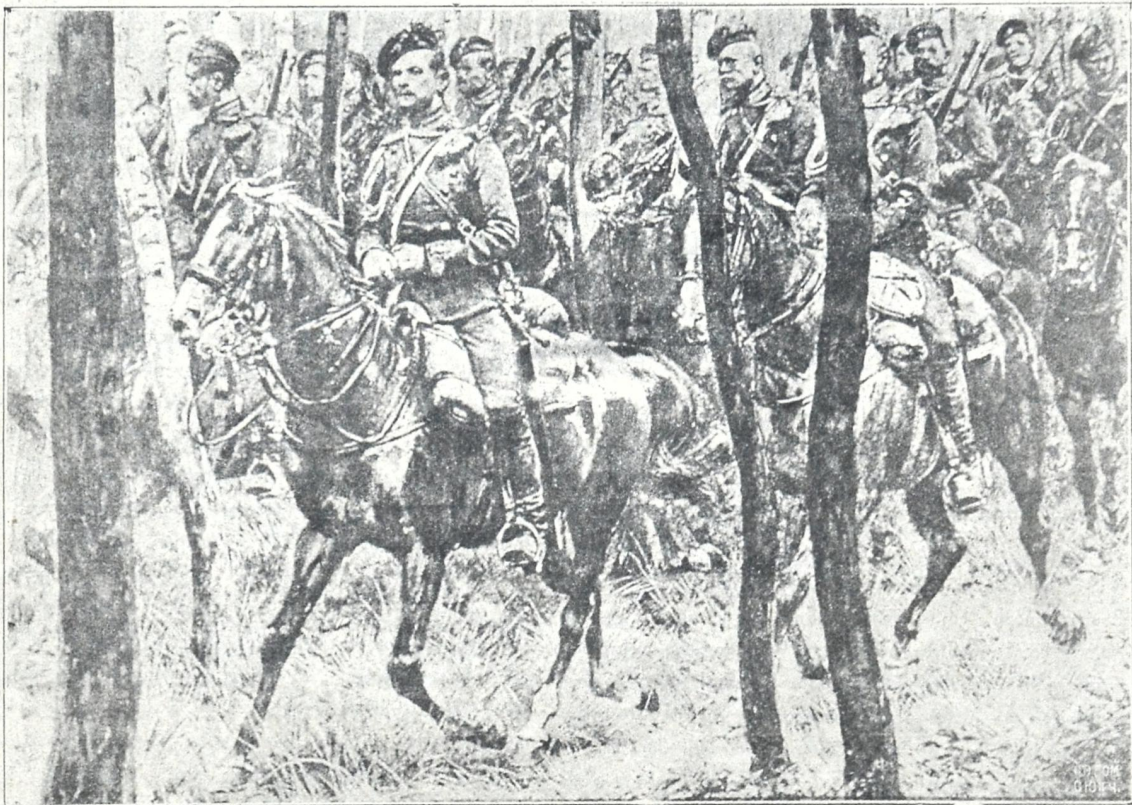
ჭ უ ლ ა ნ ე ბ ი