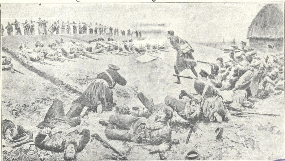
გერმანელები თეთრი დროშით სარგებლობენ და ნადგურებენ მტერს