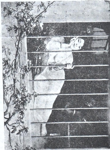
ბამეობაში, სუთათი ე. გიმბერტისა.

ღრუბელთ გროვას ცის ტანტობზე, თითქოს მოდილილს ვაქცავს, სძინავს და იმედის გასაღესათ აღარა სტექს, აღარ გრგვინავს. ქარიშხალი არ მოძრაობს, დაუშვია მასაც ფრთები, შუბლ-შეჭუმუნეთი და მოწყვეით, დასტკერიან დაბლობს მთები.