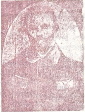
გ. წ. მეტრეველი.