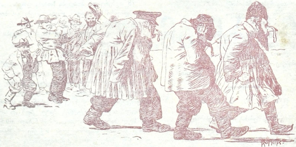
თბილისის მიკიტნების ჩივილი.

ეს საქვეყნო დიდი ომი ჩვენთვის გახდა შავი ქორი, პოლიციამ და მთავრობამ საქმე გვიყო გასაყვირი!..