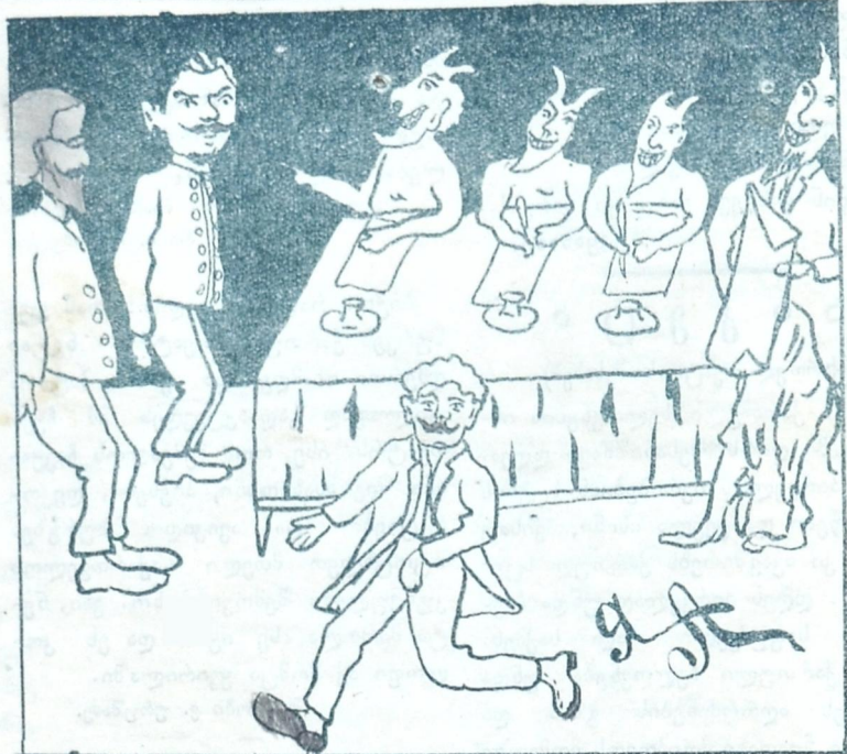
სამტრედია. წ. კ. საზოგადო კრების მიერ გადაყენებული „საზოგადო მოღვაწე“ და მათთან შეშინებული თავის მაქებარი ექიმი.

იმისთანე უბედურობა და სირცხვილი შენს მტერს დიემართოს, რაც ჩვენ ნაჭირავებ მამასახლისის დიემართა. კვირე ღამეს მისულა ბატონო ვინცხა და უთქვამს: ამა და ამ კაცისას გამოჩენილი ყაჩაღი ბენტერაშვილი ვახშამს ჭამსო, თუ შეგიძლია წიყყვანე სტრაჟები დიეცი თავზე და დეიქირეგო. დაფაცურდა თურმე ჩვენი მამასახლისი, დოუძახა სტრაჟებს ახსენეს ღმერთი შექედენ ცხენებზე და გასწიეს ყაჩაღის დასაჭირავათ. უმთვარო ღამე იყო. ერთმა თვალ მახვილმა სტრაჟმა დვინახა ვინცხა ნაბდიანი მოზავალი კაცი ფშუკაში და დოუძახა: რომელი ხარ შენო, თუ ბენტერაშვილი ხარ გირჩევენია ცოცხლად დაგვრჩიო, მიყვირა მამასახლისმა, მარა თქვენც არ მომიკვდეთ, იგი მაინც ხმას არ იღებს და გულდათ მოდის ავინისკენ, მაშინ უბრძანა მამასახლისმა სტრაჟებს, ვსროლეთო. უცბათ იგრაილა თოფებმა და იგრაილა, შეიქნა უღმერთო „ხალპი“ მთელი ჩვენი სოფელი ფეხზე დადგა. მივ