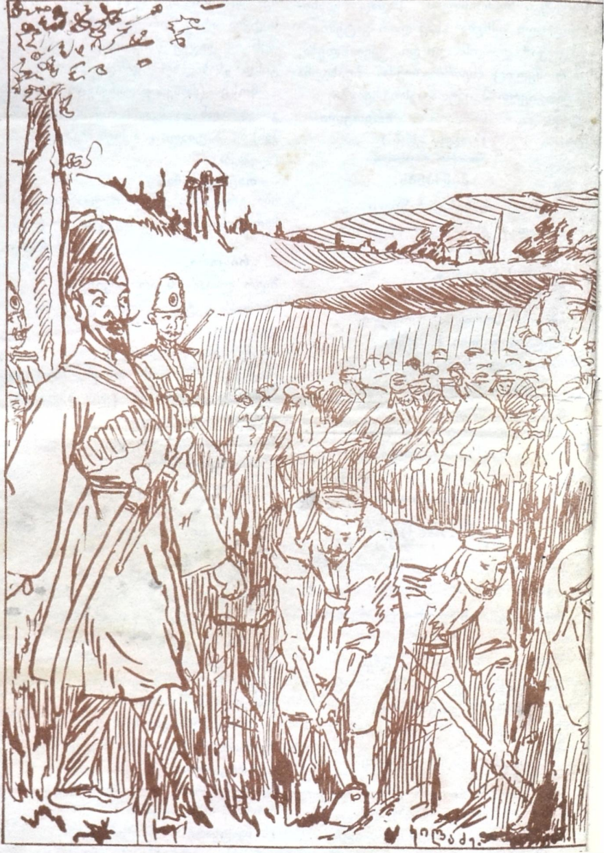
ს. სუფსაში გლეხების ვარჯიშობა ი. გურიელის მოურავის ყანაში.

ვენაცვალე მაღალ სფეროს იმან მომცა „სტიპენდია“, თუმც არ ვსწავლობ მე სკოლაში, მაგრამ არ მაქვს მის დარდია.