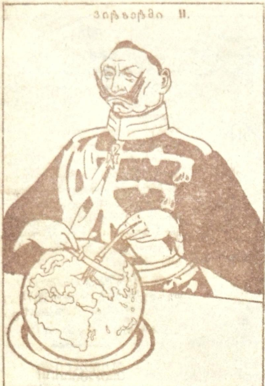
უაღრესი ხეობი ა' თუ მუკახე არ გამოეგა