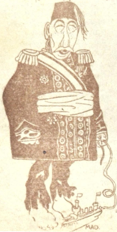
ლხიჭანის სუბთან მარტ. V.