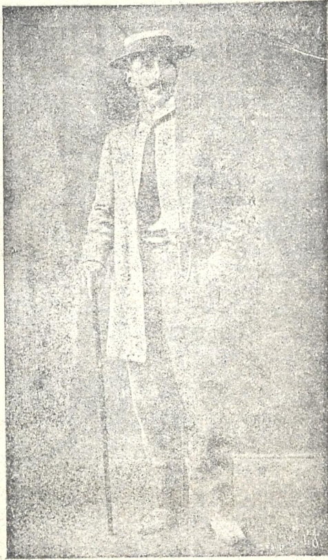
ზალერიან ირაკლის ძე შალიკაშვილი სასცენო და სამწერლო მოღვაწეობის 15 წლის შეს- რულების გამო

ქართულ მიღწეის — მსახიობ-მწერლისა და კატორღელის ბედი ერთმანეთისგან რომ დაღთ ან განსხვავდება, ეს ყველას მოეხსენება, ვინც-ც ან- ღოს იტნობს ჩვენი თეატრისა და მწერლობის მუ- ღმიე მუშაკთ.