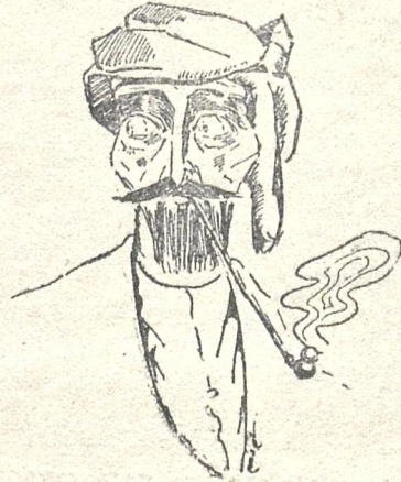
გ. ი. შ ა ლ ი კ ა შ ვ ი ლ ი შ ა რ ე ბ შ ი