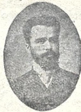
არჩილ ჯორჯაძე გარდაცვალებიდან 5 წ. გამო