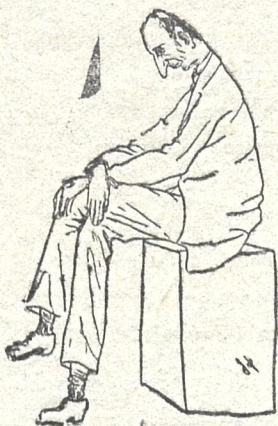
პასუ ოროცი წ. მოღვა-