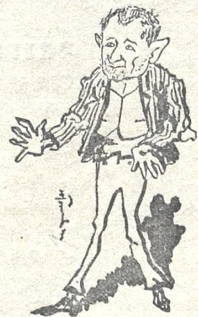
პაპიძე წებოლი გამო