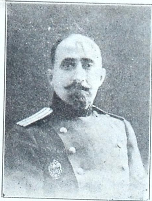
ქ. ივანე თიქანაძე სამხ. ჰოსპიტალის უფროსად დანიშნ.