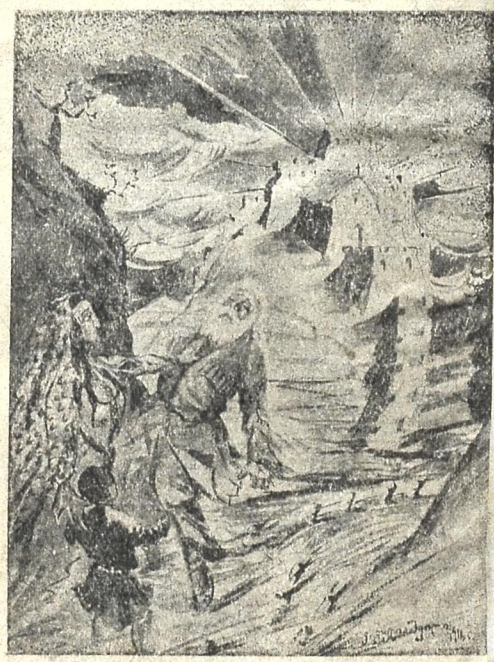
კვდება ძველი, გაუმარჯოს ახალს (ნახატი ლ. გულიაშვილის)