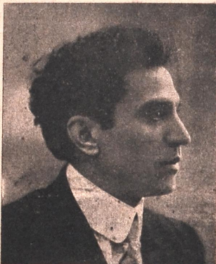
მომღერალი ივ. საჩავიშვილი ამ ზაფხულს (1 მაისიდან 1 ენკენის- თევზმდე) მიწვეულია „ახალ კლუბში“ სიმფონიურ კონცერტებზე.