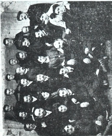
ქათურის დრ. საზ. გამგეობის წევრნი და სცენის მოყვარენი — 1907 წ.

ასე განსხვავთ ახლად მუშათა შორის რეცენსენ-