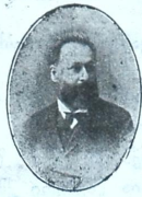
საპართო თავაჯდომ. აკაკი წერეთელი