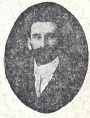
ნ. ა. ბარათაშვილი თავ მჯდომარე