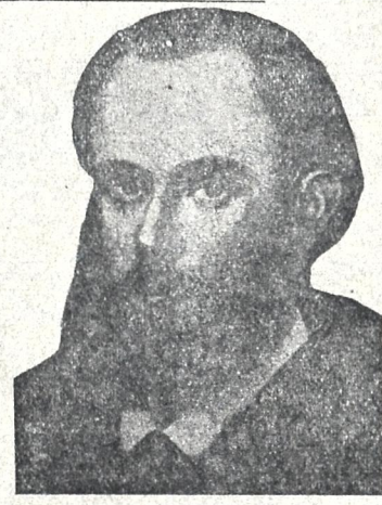
ს. ი. ნადსონი

რუსთა მგოსანი. მისი ბეგრი ლექსისა ქართულად ნათარგმნი ილ. ფერაძისა და ხუათაჯან. იანგის 19 შესრულდა მისი გარდაცვალების 30 წ. თავი. გარდაიცვალა 25 წლისა. იხ. ამავე ნომერში მისი ლექსი „იდეალი.“