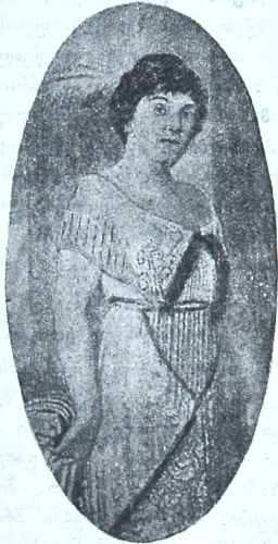
ქ-ნი ქაიო. გახ. „Figaro“-ს რედაქტორის შველელი. სსაზარტლომ-გა-ამართლა,