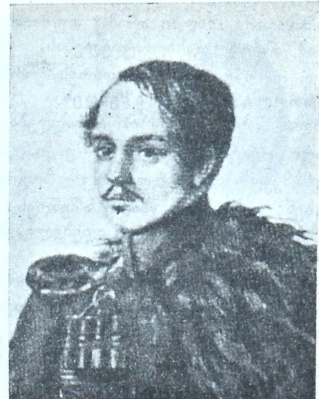
რუსეთის გამოჩენილი მკვლასანი ნ. მ. ლერმონტოვი (დაბადებიდან ასის წლის შესრულე- ბის გამო. —წერილი იხ. შემდეგ ნომერში)