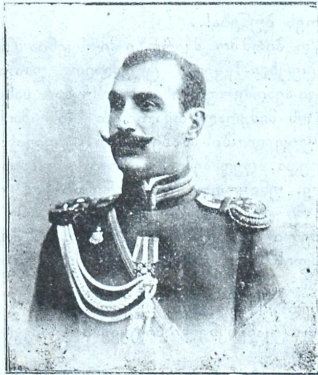
შტ.-კაპ. ლევ. გრ. გაბაშვილი მოკლული.