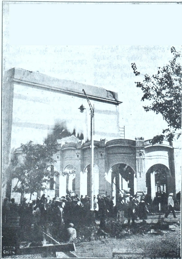
დამწვარი თეატრი(ბალის მხრით)