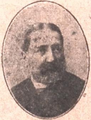
ილია ჭავჭავაძე ბატონ-ყმობის მოს- პობიდან 50 წლის შესრულების სახსოვ.