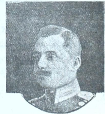
ფლ.-ად. თ. გ. ნ. ერისთავი