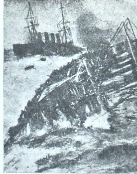
ინგლისის და გერმანიის გემების შეტაკება

იტირე, მოხუცო, იტირე: უწმინდესი გრძობა ხომ კრემლია!