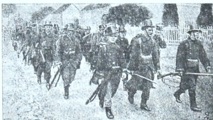
ბელგეიელი ჯარის კაცნი