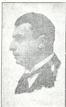
დავით აკოფაშვილი (ბარიტონი)