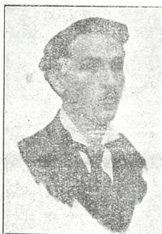
გიორგი ვენაძე (სალირიკო ბარიტონი)