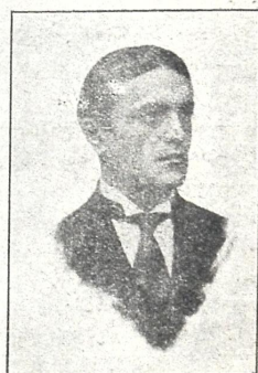
ალექსანდრე აშმეტელი (რეჟისორი)