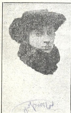
ნინო დავადელი (დამბალი სოპრანო)