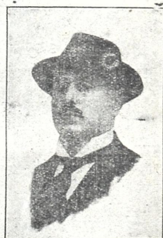
მათე ლლონტი (დრამატიული ტენორი)