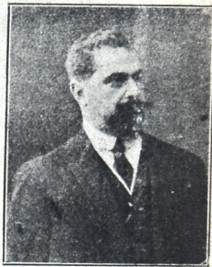
კონსტ. ნიკოლოზის-ძე აფხაზი ყოფ. მარშალი, საზოგადო მო- ღვაწე თავმჯდომარის ამხანაგია ( როსტოვი )