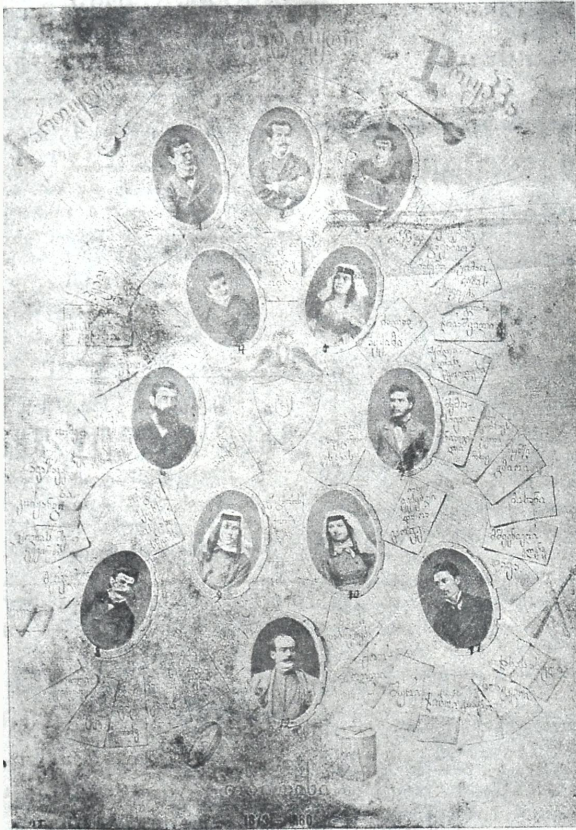
ქართული დრამატიულ დახის დაარსებიდან 40 წ. შესრულების გამო (ძველ კოლექციიდან)